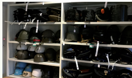
De eerste deelcollectie, hoofddeksels, is afgerond.

Een ruimte die dit jaar juist niet toegankelijk is voor bezoekers is de zogenaamde Multifunctionele Ruimte. Deze ruimte op de begane grond is momenteel in gebruik als wasstraat, een mooie naam voor een plaats waar de gehele collectie, in delen, wordt beoordeeld, geregistreerd en voorzien van barcodes. Nadat een object door de wasstraat is gegaan wordt deze opgeslagen in het depot van het Nationaal Militair Museum te Soest. Daar staat een state-of-the-art depot, voorzien van alle moderne middelen, waar de collectie onder de juiste omstandigheden bewaard wordt en bovendien altijd op afroep voor ons beschikbaar is. U kunt zich voorstellen dat dit een behoorlijke operatie is, noodzakelijk door de ontoereikende klimatologische omstandigheden in het historische weeshuis. De verhuizing van de collectie neemt zeker geheel 2020 in beslag.