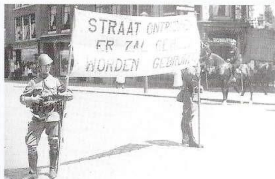
Tijdens de rellen te Rotterdam-Crooswijk in juli 1934 werden dergelijke visuele waarschuwingen aan het demonstrerende publiek gegeven.