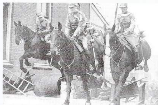
Beredenen van het Korps Politietroepen oefenen in het passeren van kleine barricaden.